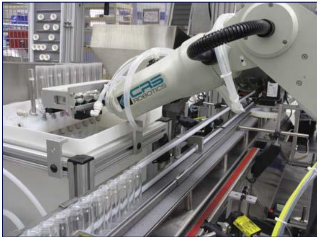
最先进的样品瓶清洗及上盖技术