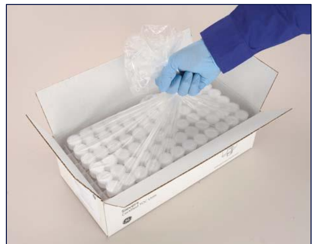
72个经验证样品瓶的标准包装

除了提供 72 个 40 mL 样品瓶的标准包装，我们也提供 Sievers 预酸化的样品瓶。他们用于清洁验证应用，以确保所有有机物都能被分析，而且样品酸度 pH 值能接近 2.5。这个预处理过程中加入的是试剂级别的磷酸，能避免蛋白质粘附在样品瓶上。Sievers 使用特殊的精准注射技术，保证每个样品瓶都经过酸化处理。我们自动、高质量系统所生产的 Sievers 预加酸样品瓶，能避免客户处理过程中产生的差异、超标检验结果（OOS）调查、人工过失造成的损失以及缩短冗长的样品准备时间。