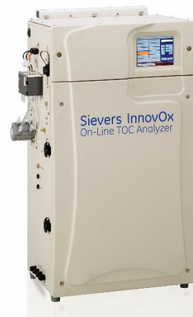
图 1: Sievers InnovOx 在线型 TOC 分析仪

具有可靠的在线分析性能的 MBR 系统所能提供的结果远非传统系统可比，这就是为什么近年来 MBR 的名声大噪。2000 年时工业型 MBR 的安装量占全部商用 MBR 安装量的约 27%。 1